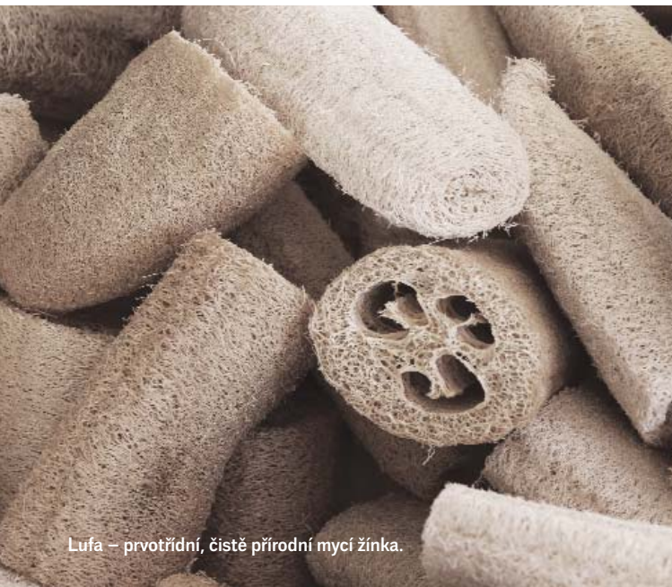
Lufa – prvotřídní, čistě přírodní mycí žínka.