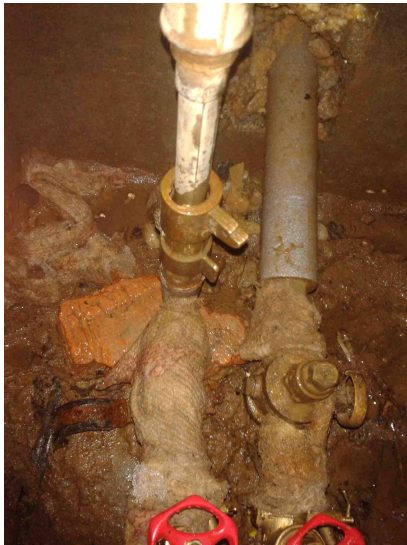
Dolní díl – uzávěr a vypouštěcí ventil