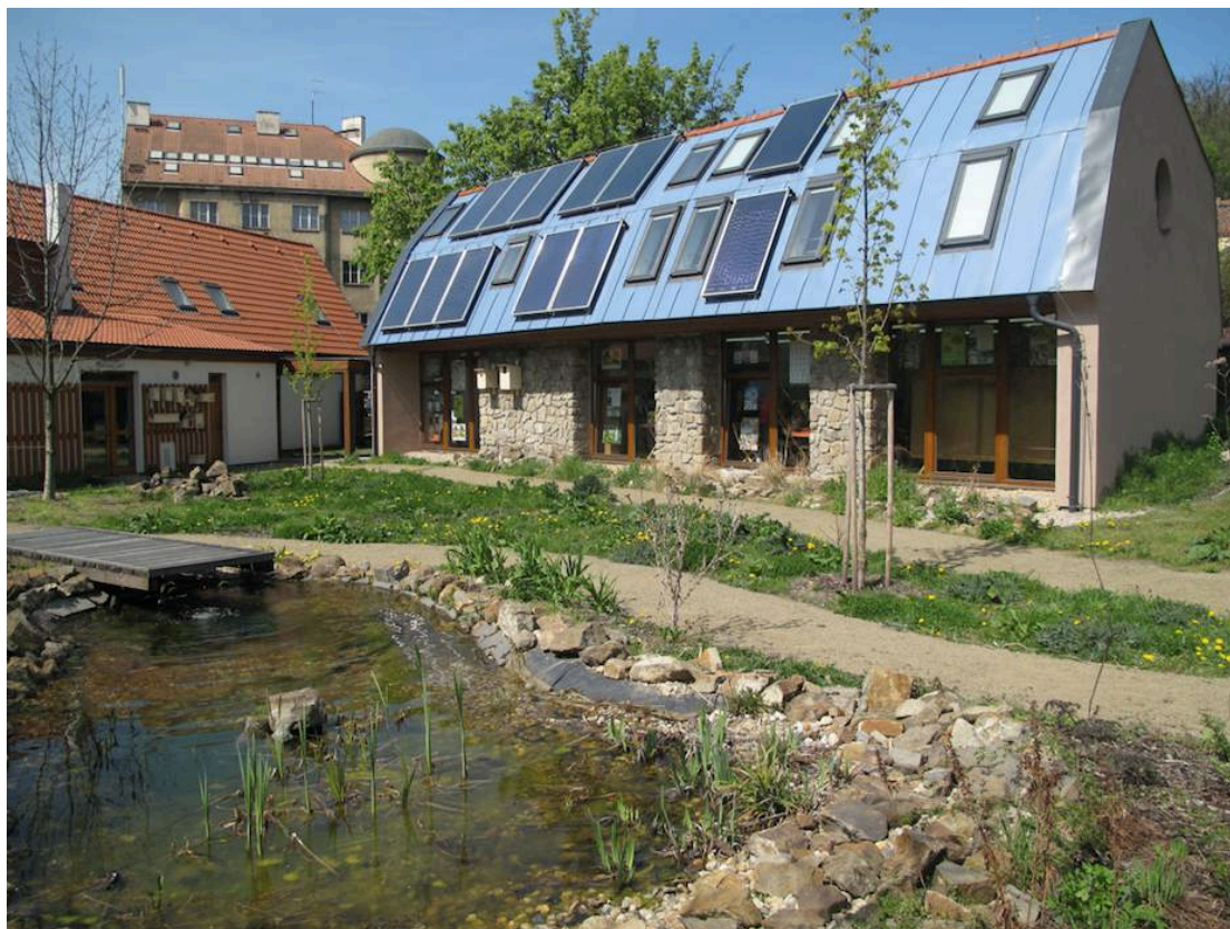
Dům ochránců přírody v Praze.

Dům ochránců přírody v Praze je základní organizací Českého svazu ochránců přírody. Její hlavní aktivitou je zajištění provozu ekocentra v Domě ochránců přírody v Michelské 5, Praze 4. V rámci této činnosti jsou nabízeny i služby firmám a veřejné správě, především odborné poradenství a semináře.