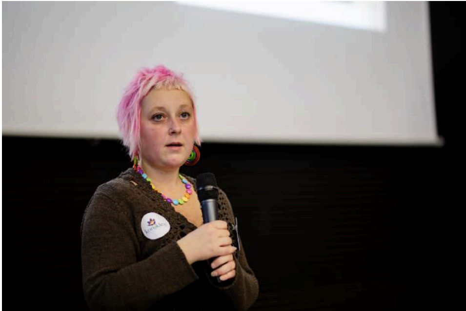
Konference EVVO 2017.