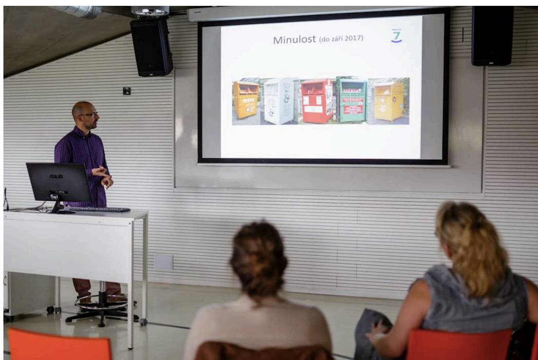
Konference EVVO 2017.

Studentský tým VŠE z předmětu Management udržitelnosti