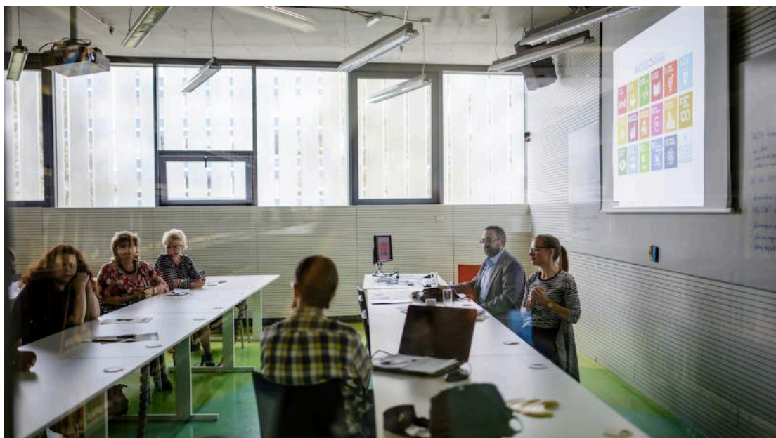
Konference EVVO 2017.