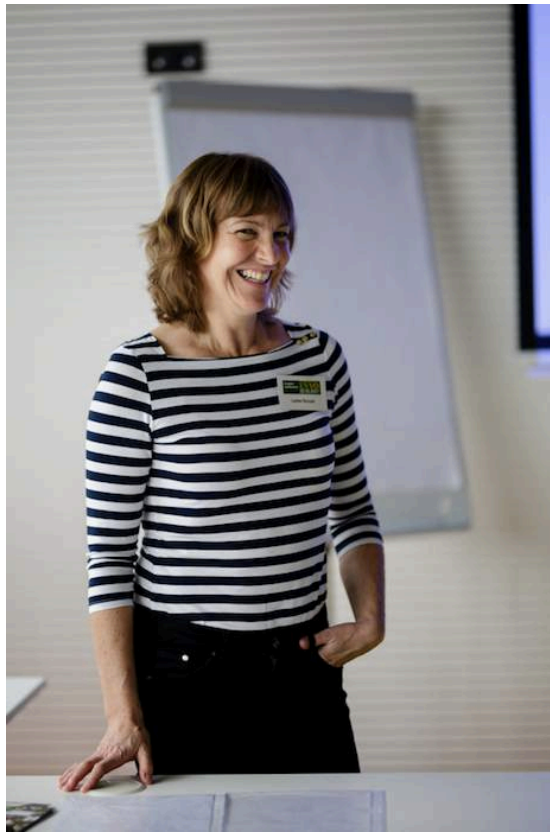
Konference EVVO 2017.