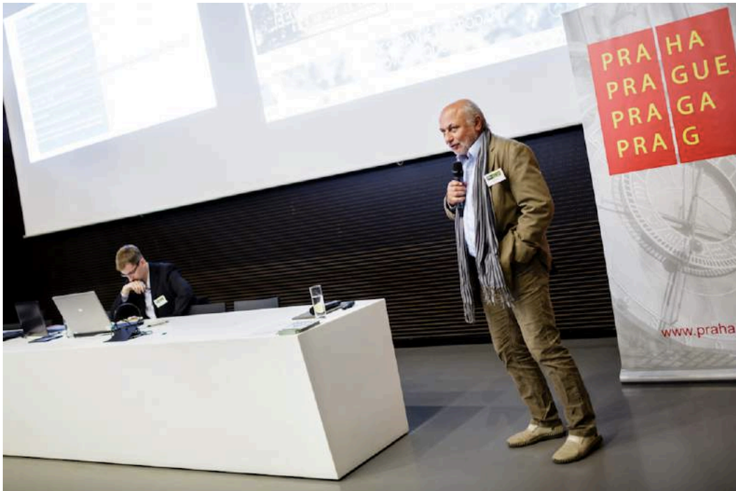
Konference EVVO 2017.