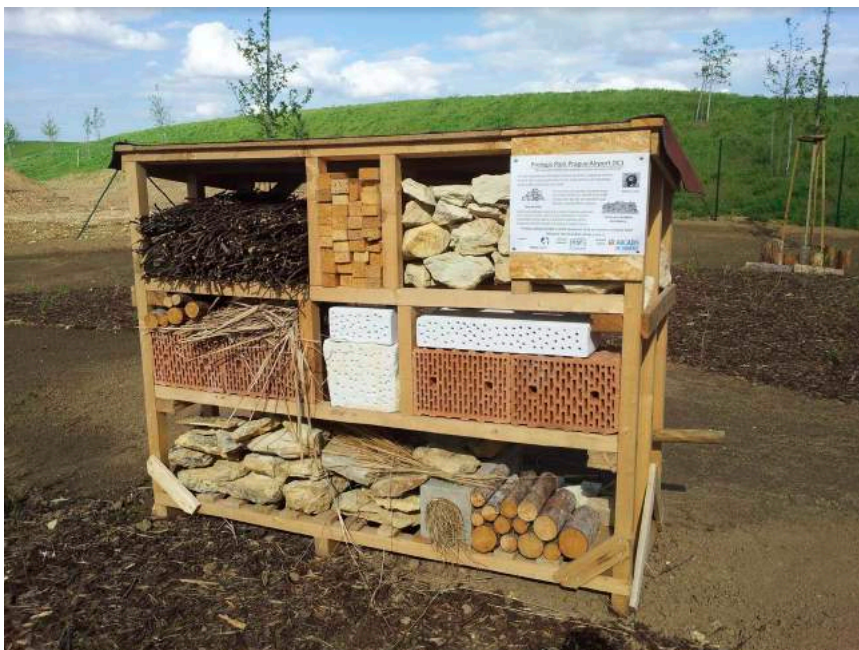
Hmyzí hotel.