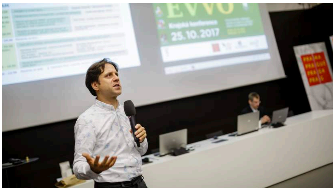
Konference EVVO 2017.