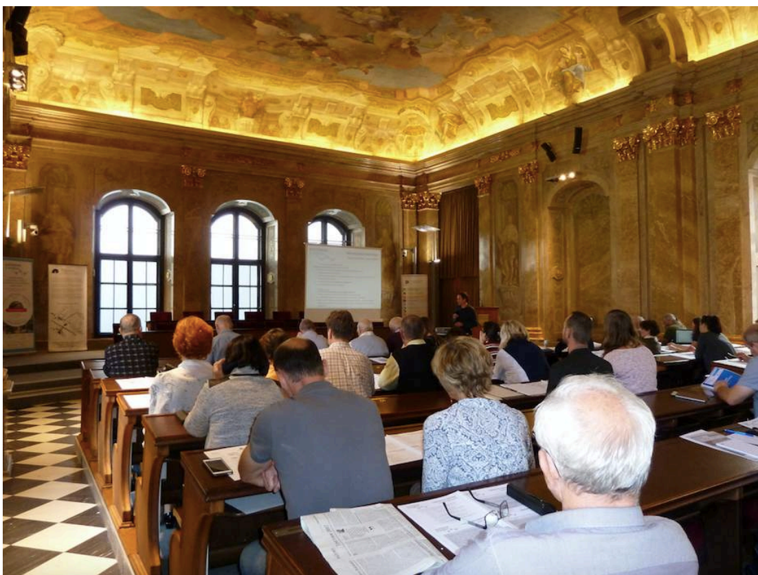
Seminář pro zástupce veřejné správy.

Více informací na www.ekocentrumkoniklec.cz .