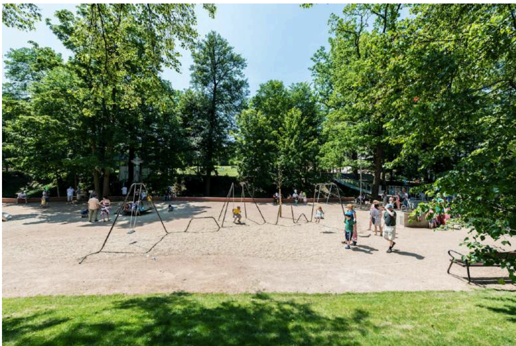
Program Parky .

Vedle pomoci konkrétním projektům se nadace věnuje všeobecné osvětě veřejnosti. Provozuje tematický Portál Promen.cz , pořádá konference, semináře, exkurze a přednášky, vydává vzdělávací materiály a seznamuje děti s architekturou a s principy tvorby městského prostředí.