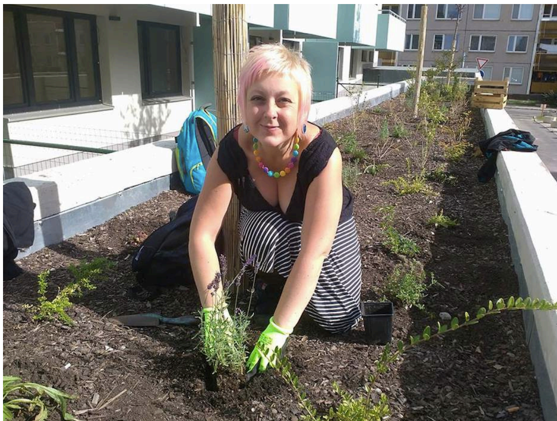
Ekologická prověrka areálu.

Naší vizí je lepší životní prostředí a vyšší kvalita života.