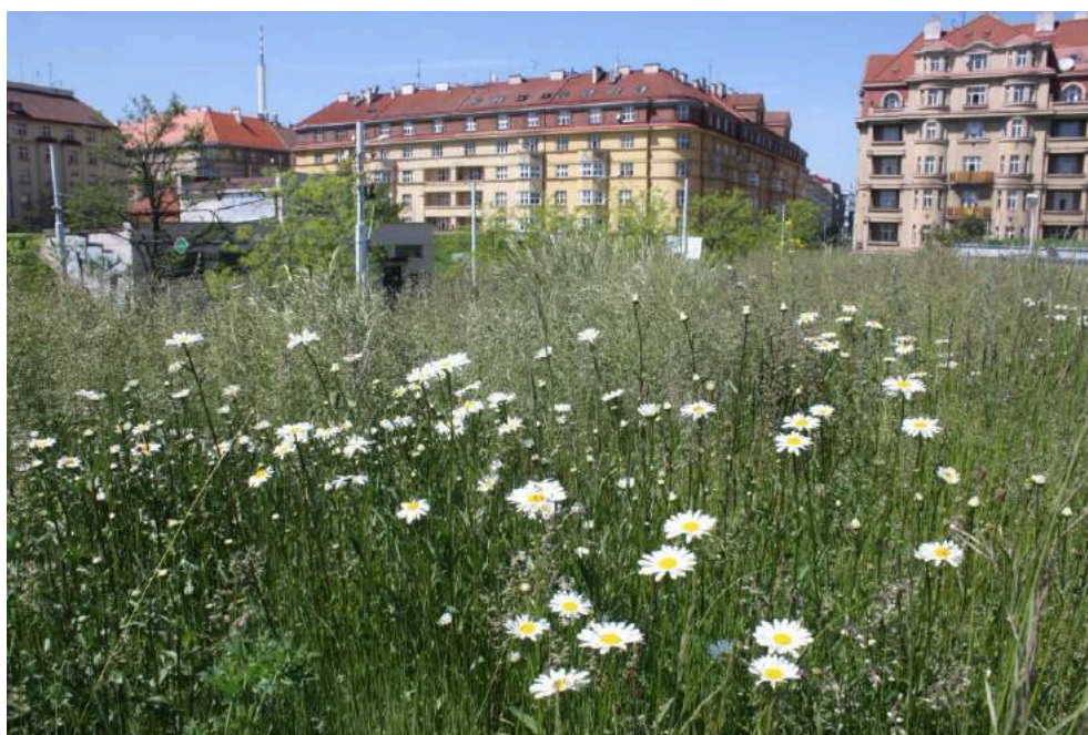
Květnatá louka vytvořená na střeše vodní nádrže v areálu PVK v Praze.

Mezi služby, které ČSOP nabízí veřejnosti, patří mimo jiné i nabídka pro firemní dobrovolníky – pomoc při různých managementových pracích, úklidech přírody apod. (CSR, teambuildingy). Pro firemní sektor kromě dobrovolnictví provádíme i posuzování venkovních areálů a budov (certifikace LEED či BREEAM) z hlediska jejich vhodnosti pro podporu biodiverzity.