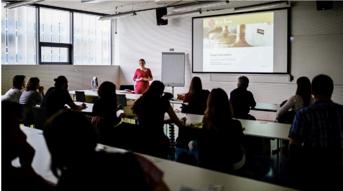
Konference EVVO 2017.