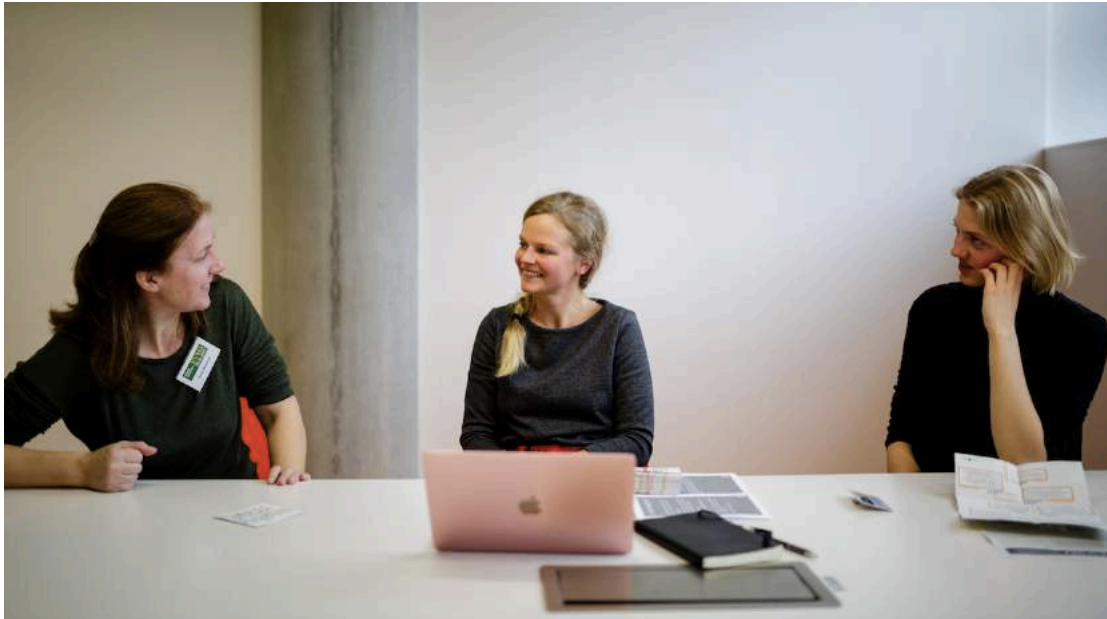
Konference EVVO 2017.