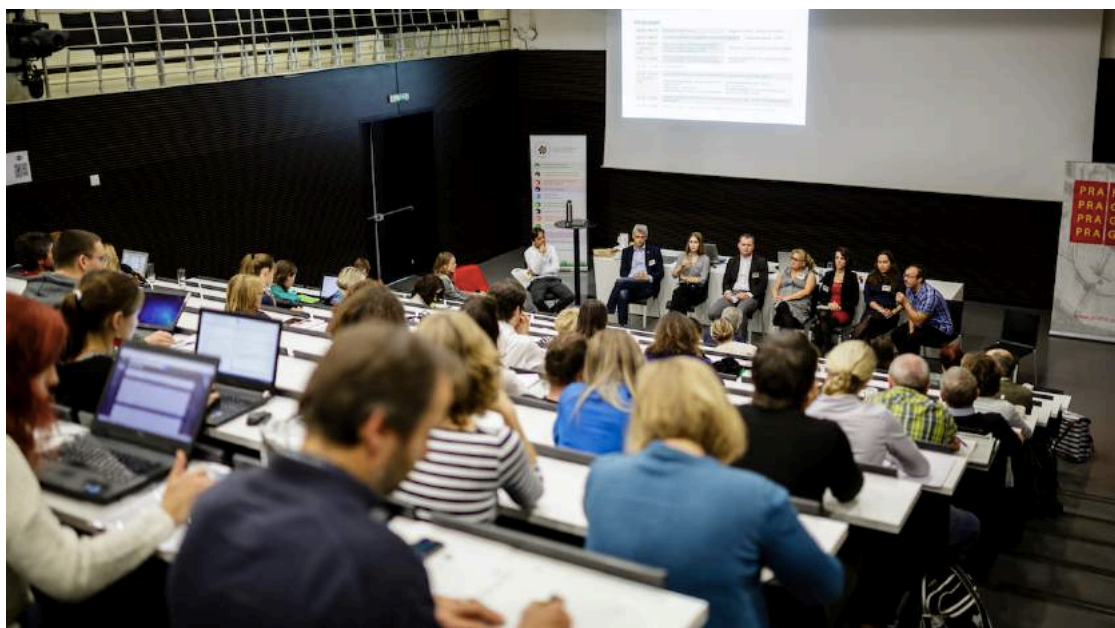
Konference EVVO 2017.