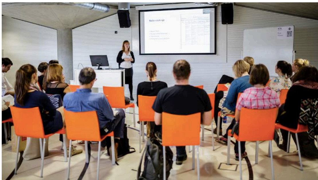
Konference EVVO 2017.

Judita Nechvátalová, Reklamní agentura Green Cat (Sdružení TEREZA)